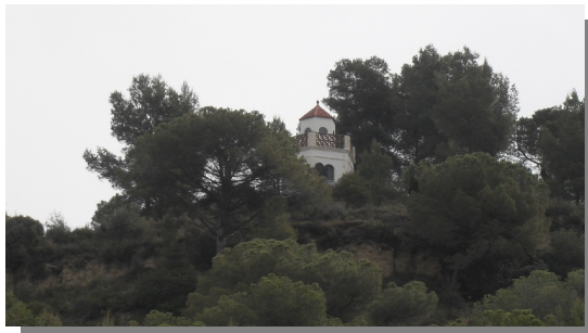
Torre de guaita per a prevenció d'incendis