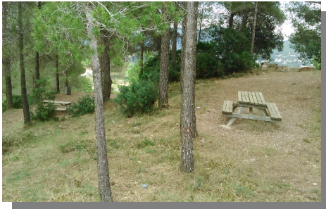
Zona de pícnic i interacció amb la natura