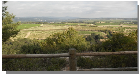
Mirador del Penedès

Després de l'arranjament de l'espai que l'any 2004 van dur a terme la Regidoria de Medi Ambient de l'Ajuntament de Sant Sadurní d'Anoia i l'Agrupació de Defensa Forestal de Sant Sadurní, l'indret ofereix diferents possibilitats d'esbarjo i és un peça important en la prevenció i extinció d'incendis.